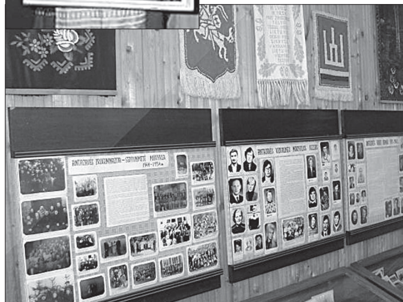
Nuotraukos ir tekstas iš visitzarasai.lt.

Iš Lietuvos Laisvė Partizanai (Istorijos muziejus)