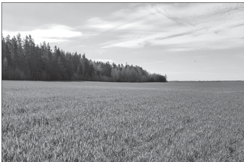
Apie pasėlių deklaravimo naujoves ūkininkai informuojami įvairiomis priemonėmis.

Kitas žinotinas dalykas – tikslinami bendrieji šienavimo reikalavimai tiesioginėms išmokoms gauti. Kai ekologinių sistemų ar kaimo plėtros intervencinių priemonių reikalavimuose nenustatyta kitaip, ūkininkai pievas ir ganyklas, žolinių