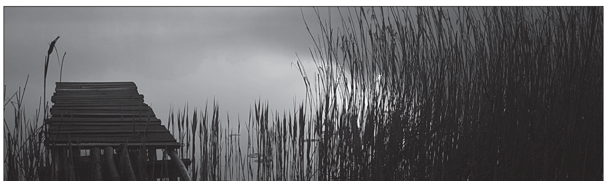
Parengė Danutė PULOKAITĖ, Vasilijaus KUKONENKOS nuotraukos.

Žodžiu gimtuoju tėviškės rugius Pašaukime, taip pat paukščius ir gojų. Kaip Marcinkevičius, Poetas didis mūs, Dėkoju už saldumą žodžių Tau, gimtoji!