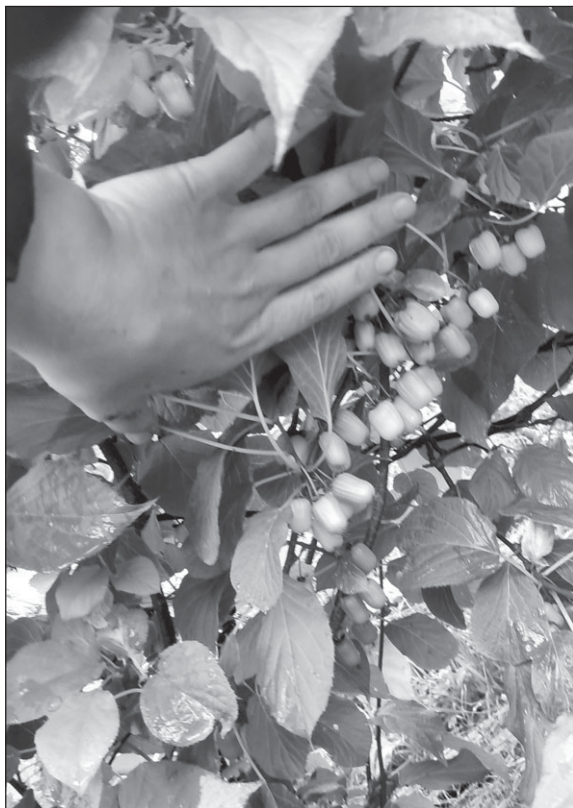
Aktinidijas nuo šalnų saugo už paramą įsigyta rūko sistema.

„2021 m. su vyru Tadu nusprendėme įveisti 1 ha aktinidijų plantaciją, bet tam reikia nemenkų investicijų, nes nepakanka įsigyti daigų ir jais apšodinti pasirinktą plotą. Aktinidijos – sumedėjęs vijoklinis augalas, ir jam auginti reikalingos 3 metrų aukščio tvirtos metalinės atramos. Reikalinga ir augalų laistymo sistema. Kadangi aktinidija neatspari pavasarinėms