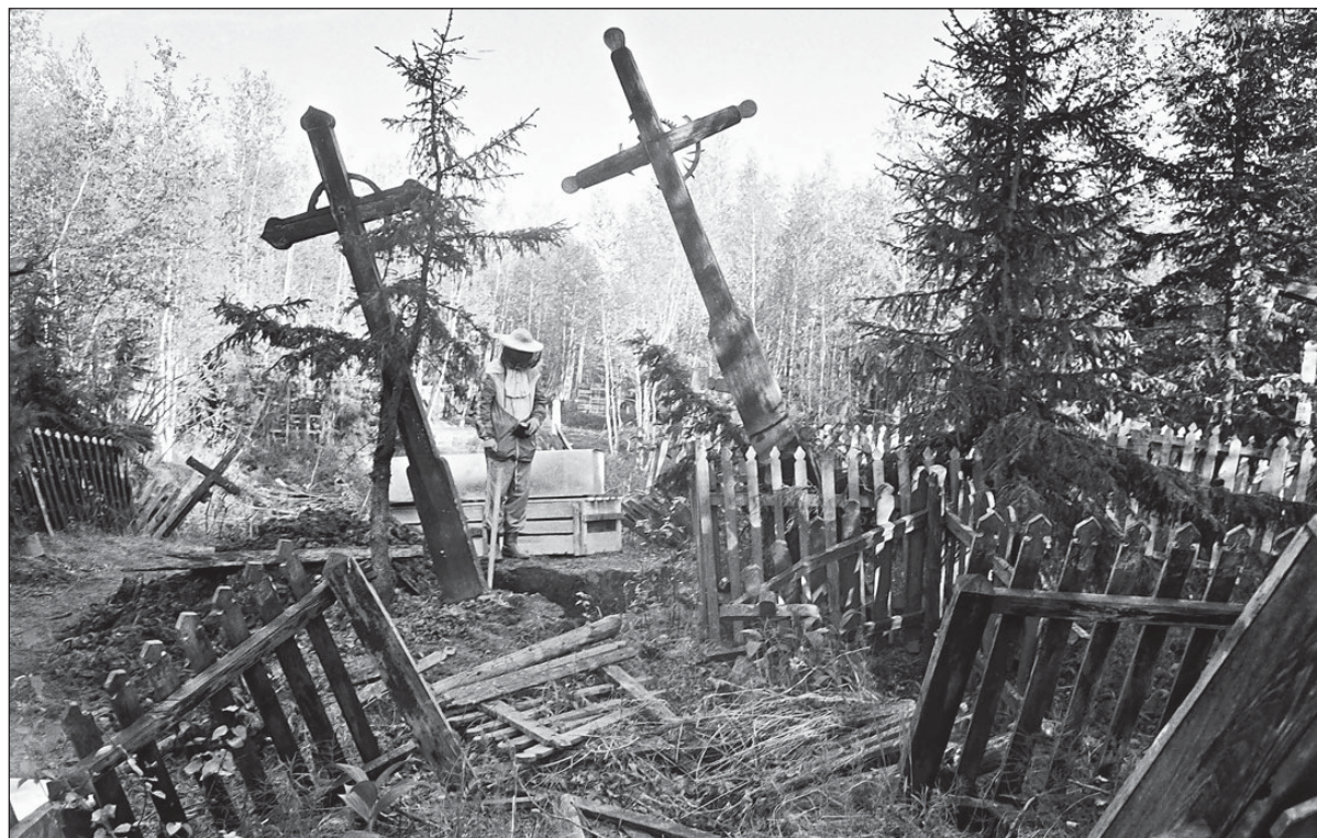
1989 m. Igarkos lietuvių tremtinių kapinės.

Politinė reklama bus apmokėta iš Lietuvos valstiečių ir žaliųjų sąjungos PK sąskaitos. Užs. Nr. 4750.