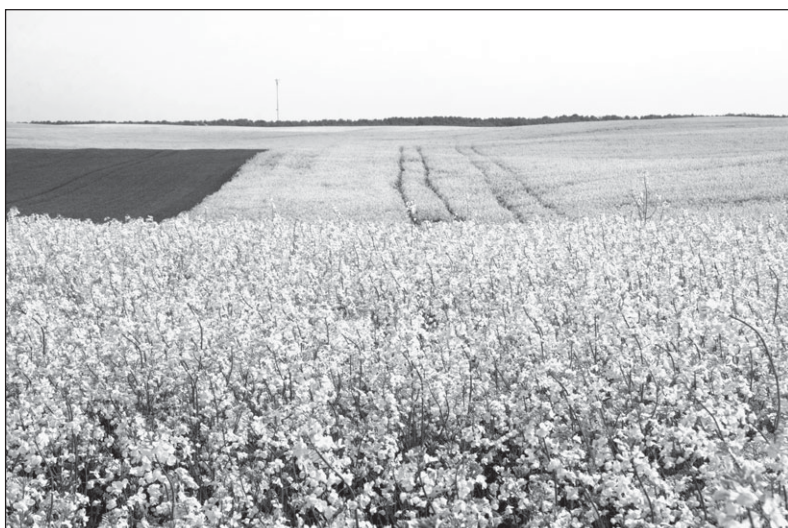
Ūkininkų derlių, jų dirbamos žemės kokybę neigiamai veikia įvairios aplinkybės: klimato kaita, gyvūnų ir augalų ligos, kenkėjai, trąšų, degalų brangimas ir daug kitų.

RVF – savanoriška žemės ūkio subjektų tarpusavio pagalbos sistema, grindžiama narių įnašais ir skirta jų pajamų lygiui palaikyti. „Šis finansinis instrumentas ūkininkams padeda apsaugoti nuo galimų nuostolių, patiriamų dėl klimato kaitos, plintančių gyvūnų ir augalų ligų, kenkėjų, geopolitinių veiksnių, prekybos globalizavimosi, energetinių išteklių, trąšų, degalų brangimo, dėl ko jų pajamos tampa nestabilesnės. Patiriami dideli pajamų sumažėjimai kelia grėsmę ūkių ekonominiam gyvybingumui ir išlikimui, – galimybę ūkininkams pristato Žemės ūkio ministerijos (ŽŪM) Strateginio planavimo skyriaus vyriausioji